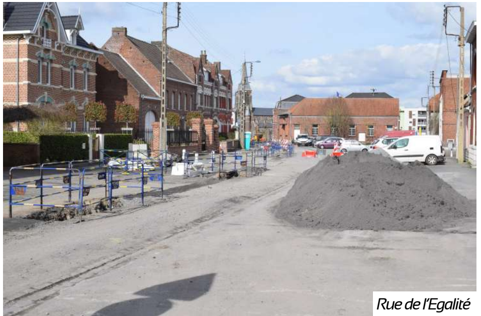
Rue de l'Égalité

Ils sont réalisés en amont de la future réfection de la voirie qui seront entrepris par la commune, lors du second semestre 2024.