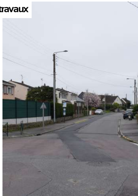
Rue du 8 mai 1945

Depuis le 18 mars 2024, l'Entreprise EITF procède à des travaux d'enfouissement des câbles HTA inter-éolien, rue de Cantin. Ces travaux nécessitent de barrer la route dans les deux sens de circulation avec déviation par les rues adjacentes et les fermetures à la circulation. (arrêté municipal 2024-n° 068-S).