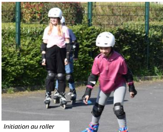
Initiation au roller