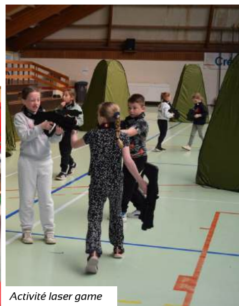
Activité laser game