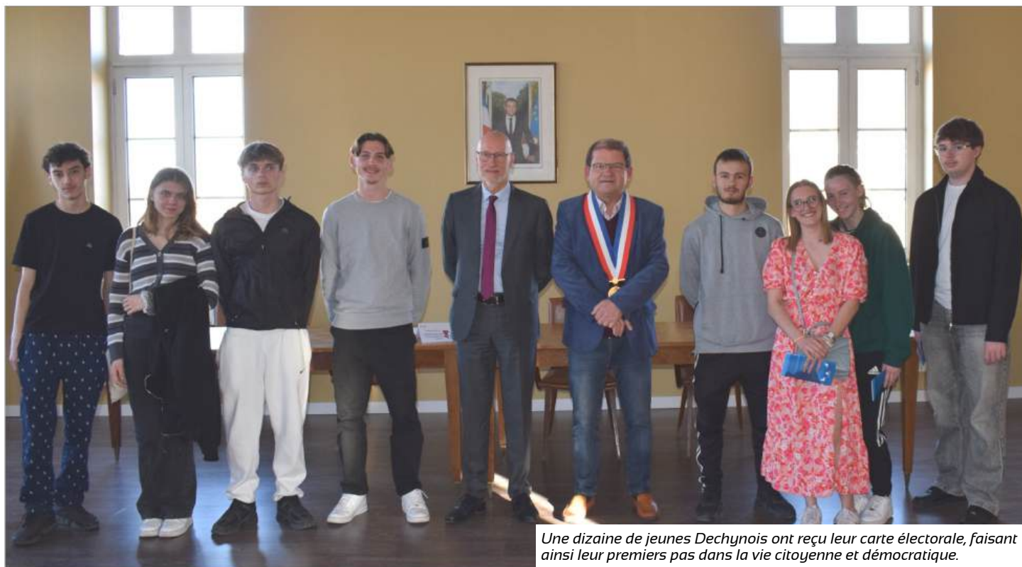
Une dizaine de jeunes Dechynois ont reçu leur carte électorale, faisant ainsi leur premiers pas dans la vie citoyenne et démocratique.

Vendredi 11 avril une dizaine de Dechynois ont reçu leur carte d'électeur. Un pas de plus dans leur vie de citoyen.