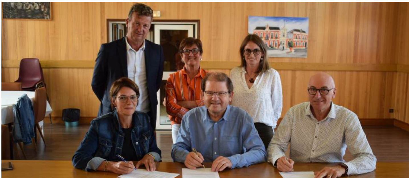
En 2022, la municipalité a signé une convention avec l'Education Nationale et l'IME La Pépinière fixant les modalités d'accueil d'une unité d'enseignement en maternelle pour les enfants présentant des troubles autistiques à l'école maternelle de la Longue Borne.

La convention entre l'IME (Institut médico-éducatif) La Pépinière, l'Education nationale et la municipalité est reconduite pour l'année scolaire 2025-2026, réaffirmant ainsi l'engagement commun envers l'inclusion des enfants présentant des troubles du spectre de l'autisme (TSA).