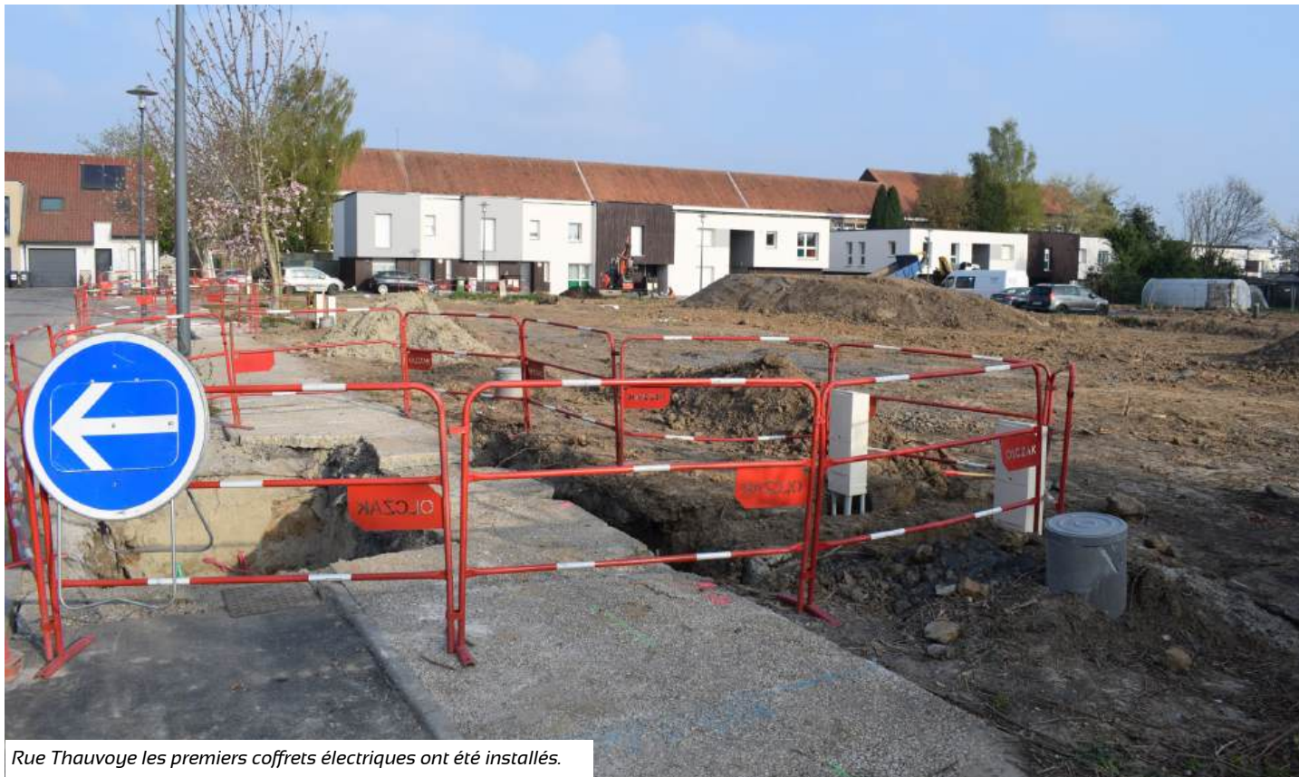
Rue Thauvoye les premiers coffrets électriques ont été installés.

Comme annoncé lors de la cérémonie des vœux, 17 logements locatifs sociaux sont en construction rue Gisèle Thauvoye et rue d'Estienne d'Orves.