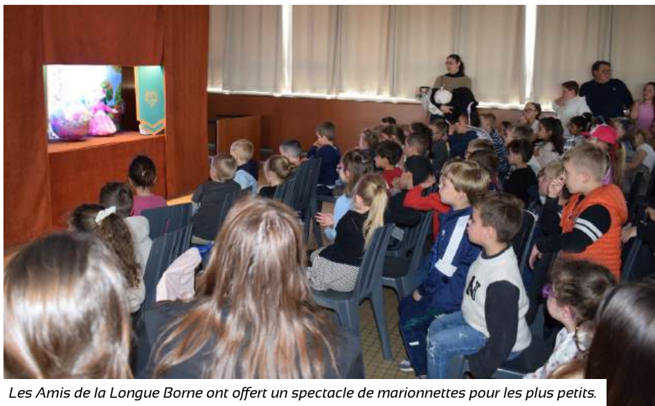
Les Amis de la Longue Borne ont offert un spectacle de marionnettes pour les plus petits.

plus démontré leur importance dans l'offre de loisirs pour les jeunes de la commune. Grâce à l'engagement des équipes d'animation et à la diversité des activités proposées, ces vacances ont été une véritable réussite, laissant derrière elles des sourires et des souvenirs précieux pour chacun des enfants. Rendez-vous est déjà pris pour les prochaines vacances !