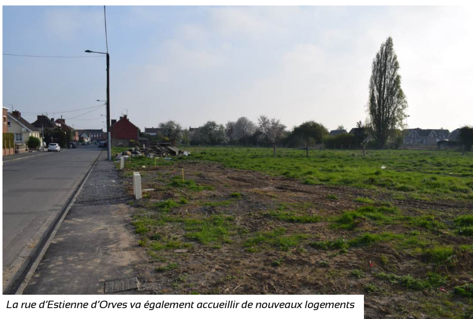
La rue d'Estienne d'Orves va également accueillir de nouveaux logements

Les futurs résidents pourront bénéficier de logements modernes, conçus pour répondre aux normes de performance énergétique actuelles, garantissant ainsi des charges maîtrisées. Les travaux viennent de débuter par